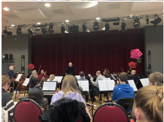
Cyłodniowska proba briaady w SLA.